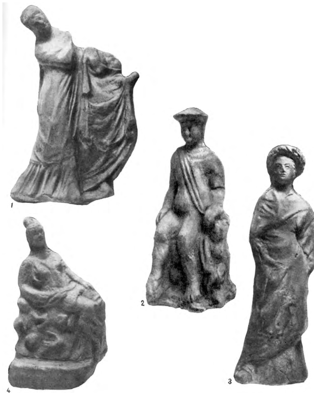
Рис. 5. Терракоты из женского погребения [по: Кобылина, 1974, №№ 56–59]. Fig. 5. Terracottae from a female burial [by: Kobylina 1974, №№ 56-59].