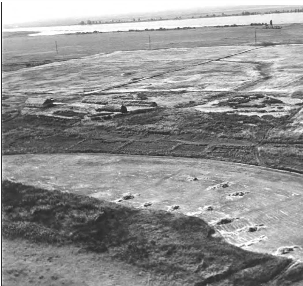
Рис. 3. Елизаветовское городище. Вид с северо-запада (фото 1954 года).