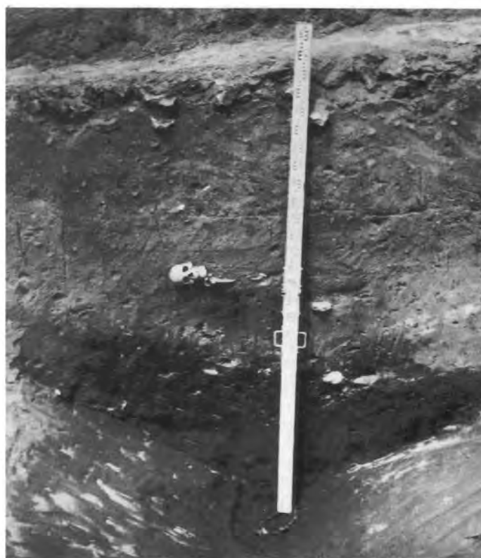
Рис. 2. Костяк человека в заполнении оборонительного рва.