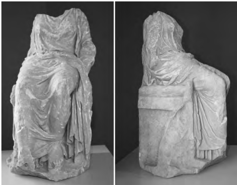
Рис. 6. Культовая статуя из Ольвии.

1 – из Пантикапея (по Саверкиной, 1986); 2 – из Дионисополиса (по Lazarenko, Mircheva, Encheva, Sharankov, 2010).