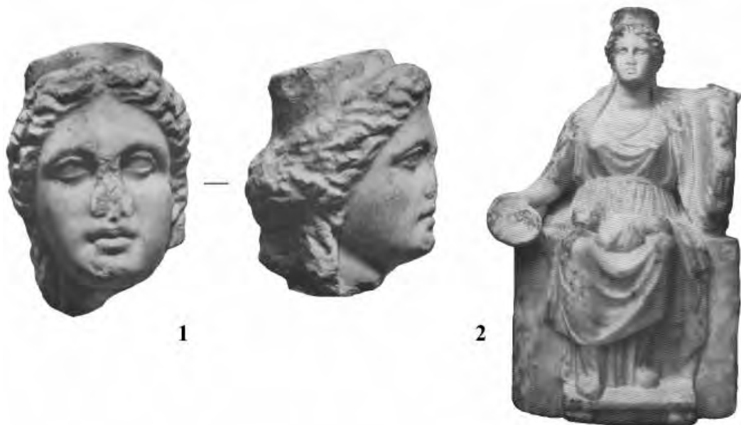
Рис. 3. 1 – голова Кибелы из Херсонеса; 2 – статуэтка из Амстердама.