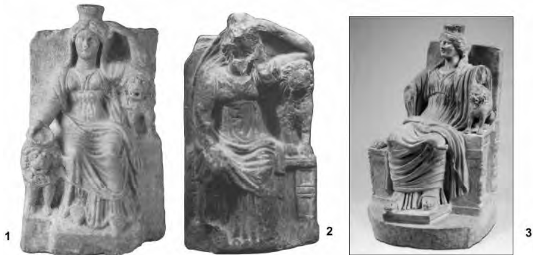
Рис. 7. Вотивные статуэтки:

1 – из Пантикапея (по Диатроптов, Журавлев, Ломгадзе, 2002); 2, 3 – из Вифинии и Мадрида.