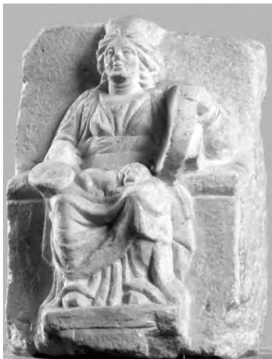
Рис. 2. Вотивный горельеф с изображением Матери Богов в образе старой женщины из Ольвии.