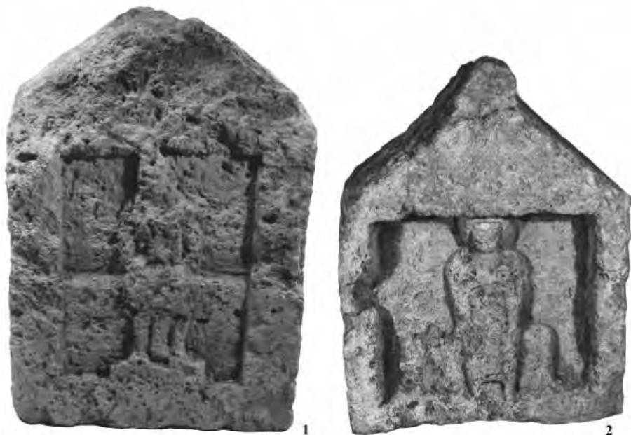
Рис. 1. 1–2 – вотивные стелы из Ольвии.