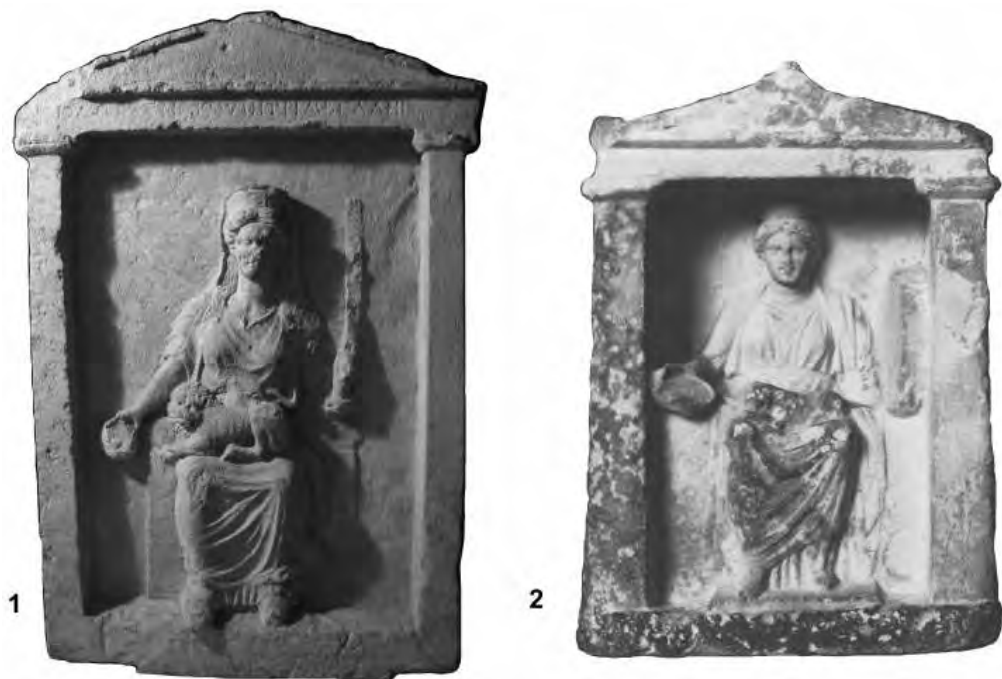
Рис. 4. Вотивные стелы: 1 – из Херсона (по Бехтер, 2013); 2 – из Копенгагена (по Naumann, 1983).