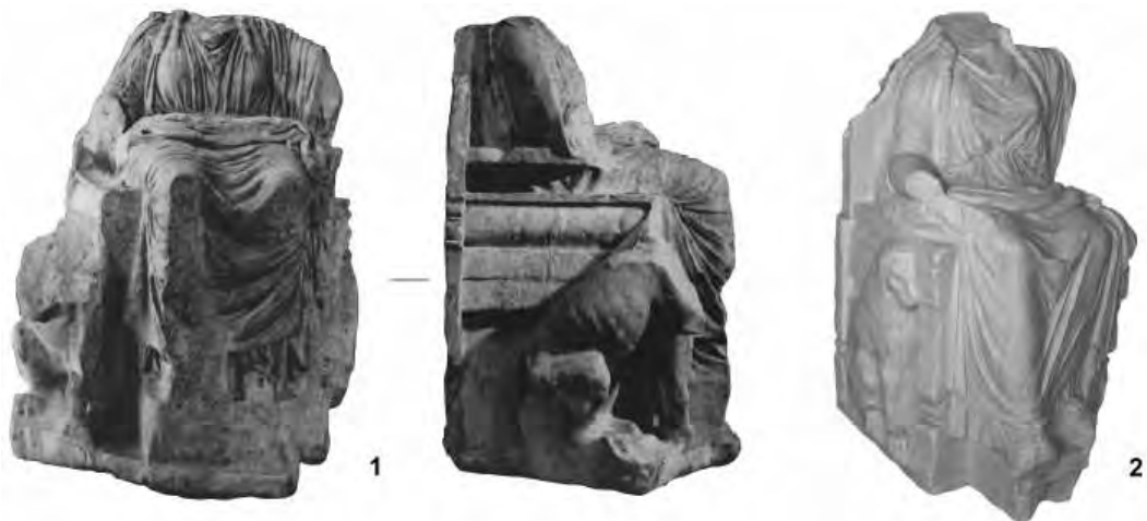
Рис. 5. Культовые статуи:

1 – из Пантикапея (по Саверкиной, 1986); 2 – из Дионисополиса (по Lazarenko, Mircheva, Encheva, Sharankov, 2010).