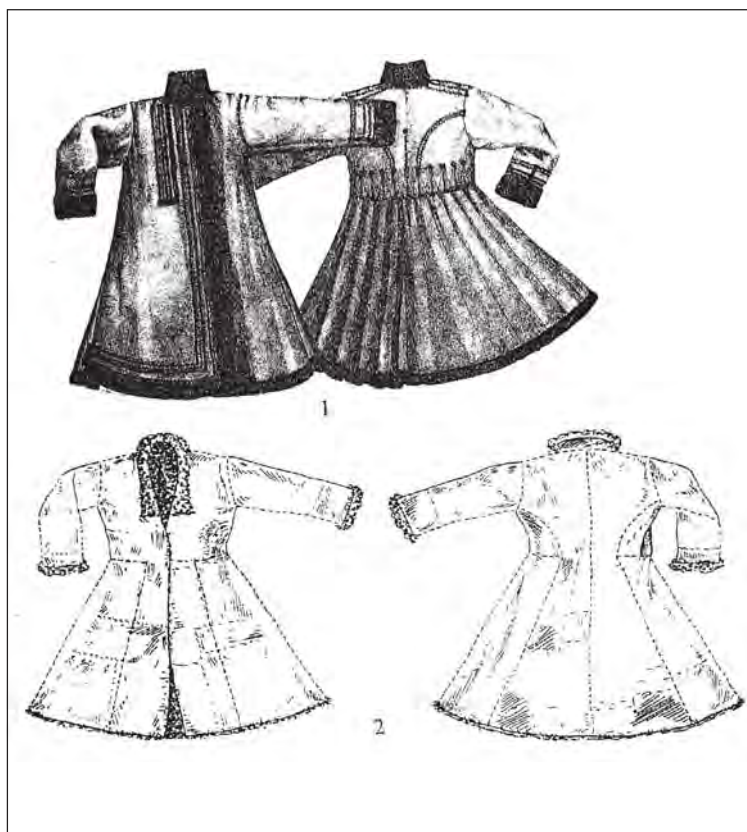
Рис. 3. Мужская верхняя одежда украинцев и жителей Северного Кавказа:

4–6 – Северный Кавказ, XIX в. (по данным Е. Н. Студенецкой).