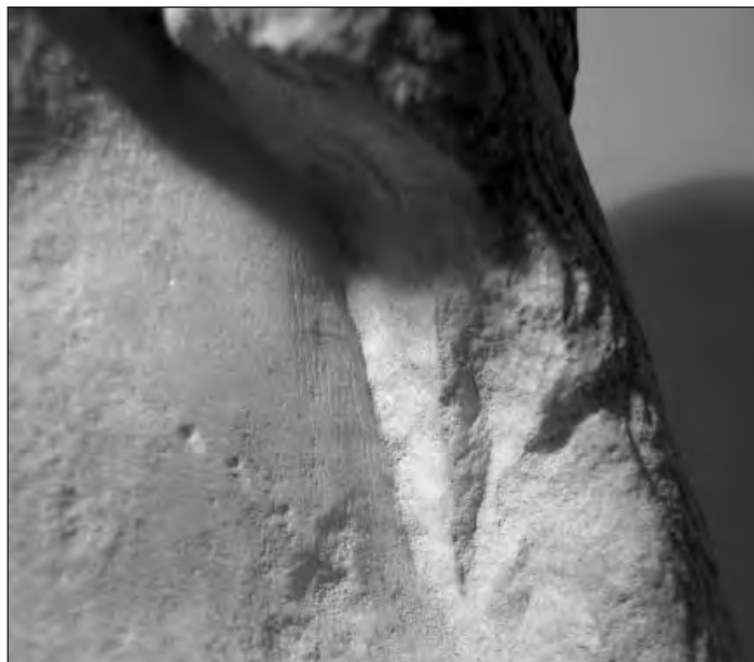
Рис. 2. Герма Деметры. Деталь левой боковой стороны шеи. Фактура поверхности: полировка, следы инструмента скульптора (рашпиль).