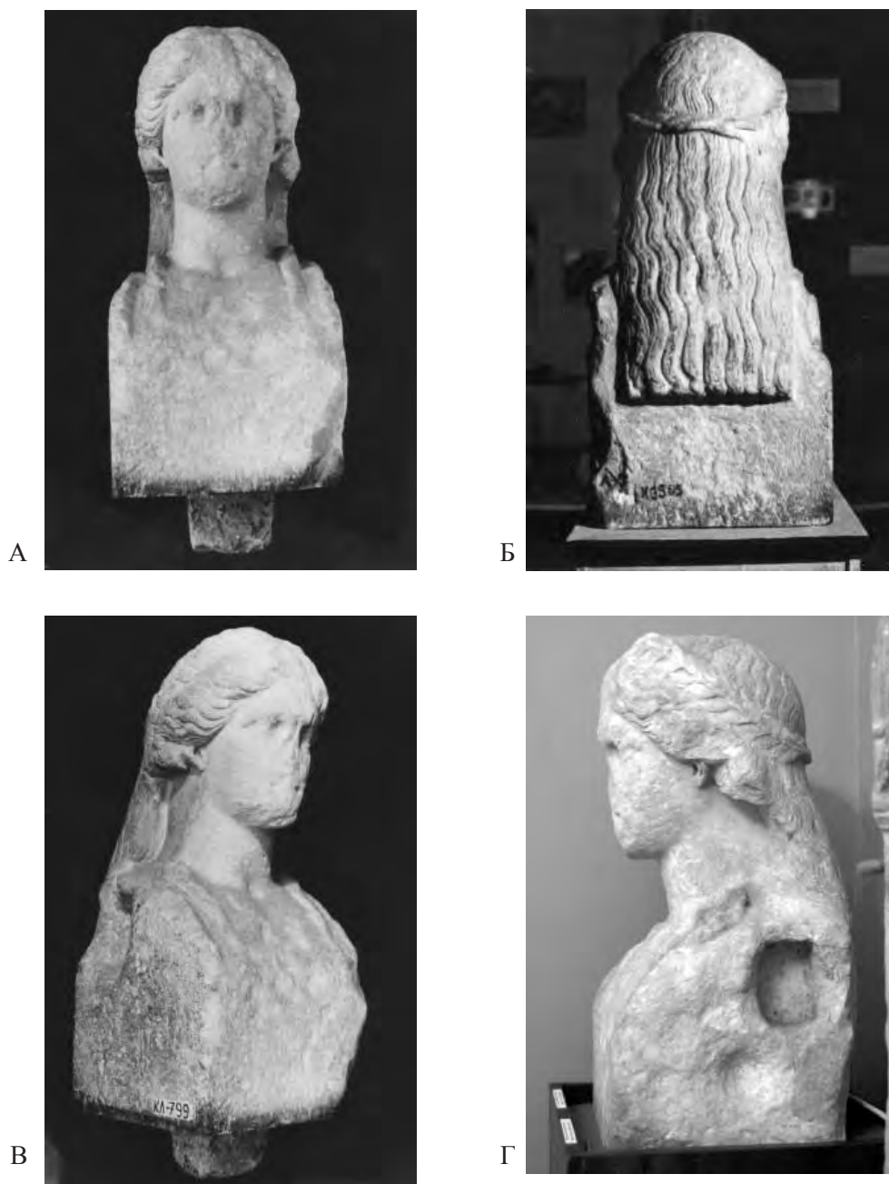
Рис. 1 А–Г. Герма Деметры. Мрамор. Высота 0,76 м. Восточно-Крымский историко-археологический музей-заповедник. Инв. КЛ-799, К3565 (рис. 1 А–В – из фондов Керченского историко-археологического музея, рис. 1Г – фото автора).