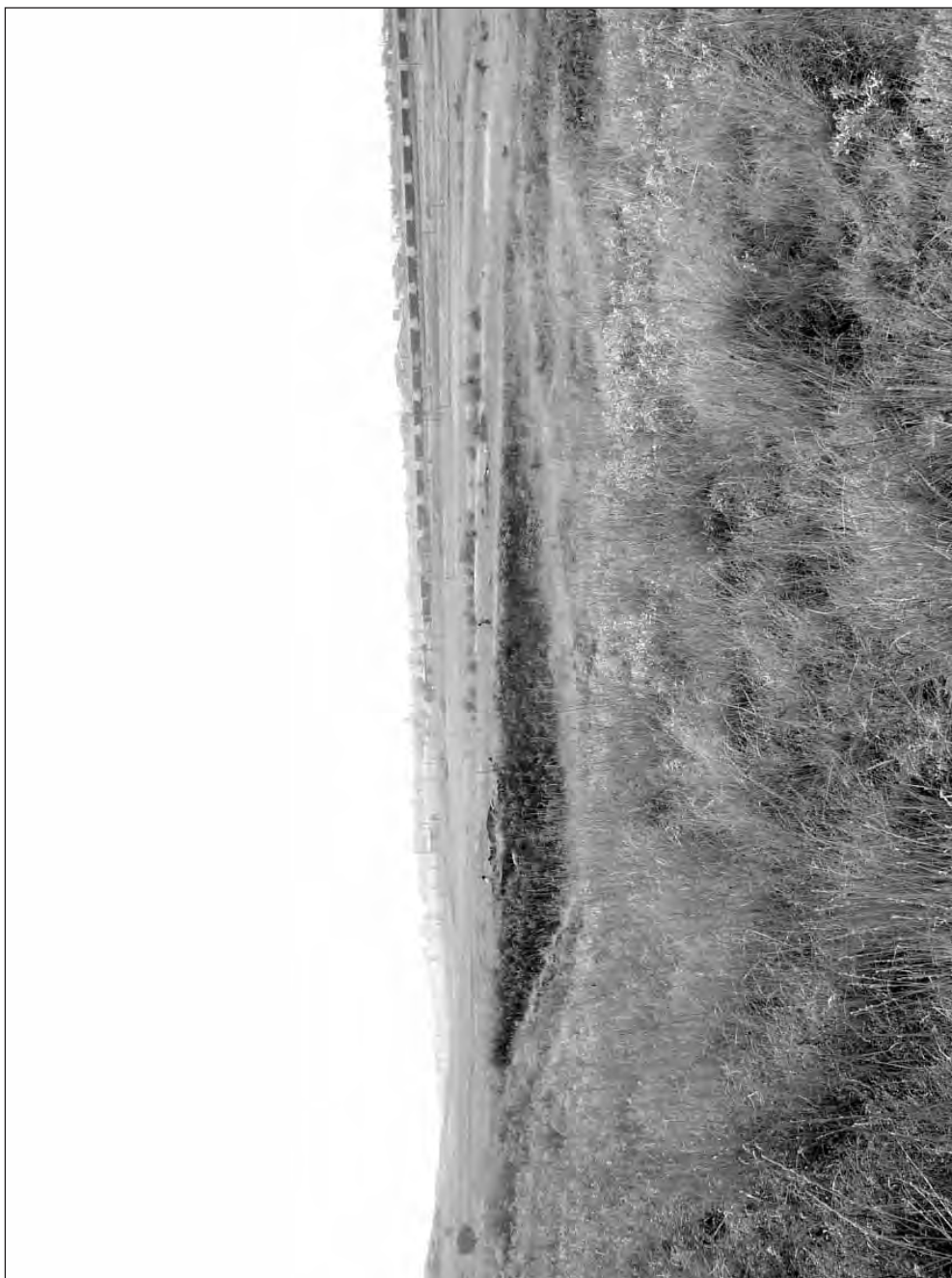
Рис. 1. Участок некрополя к востоку и юго-востоку от карьера, исследованный в 2007 г.