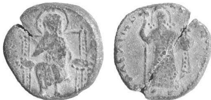
Рис. 2. Печать императора Алексея I Комнина.