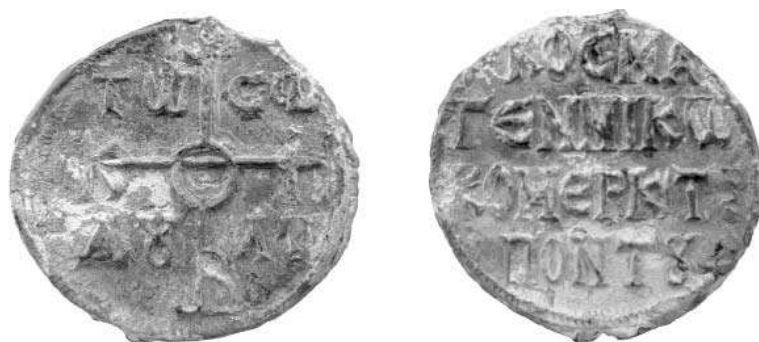
Рис. 3. Печать патриарха Мефодия I.