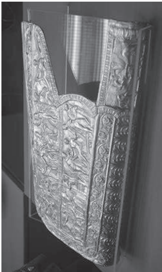
Рис. 3. Обкладка горига из Восьмого Пятибрагнего кургана [ https://www.msk.kr.ru/daily/27068/4137878/ Дата обращения 09.04.2010].