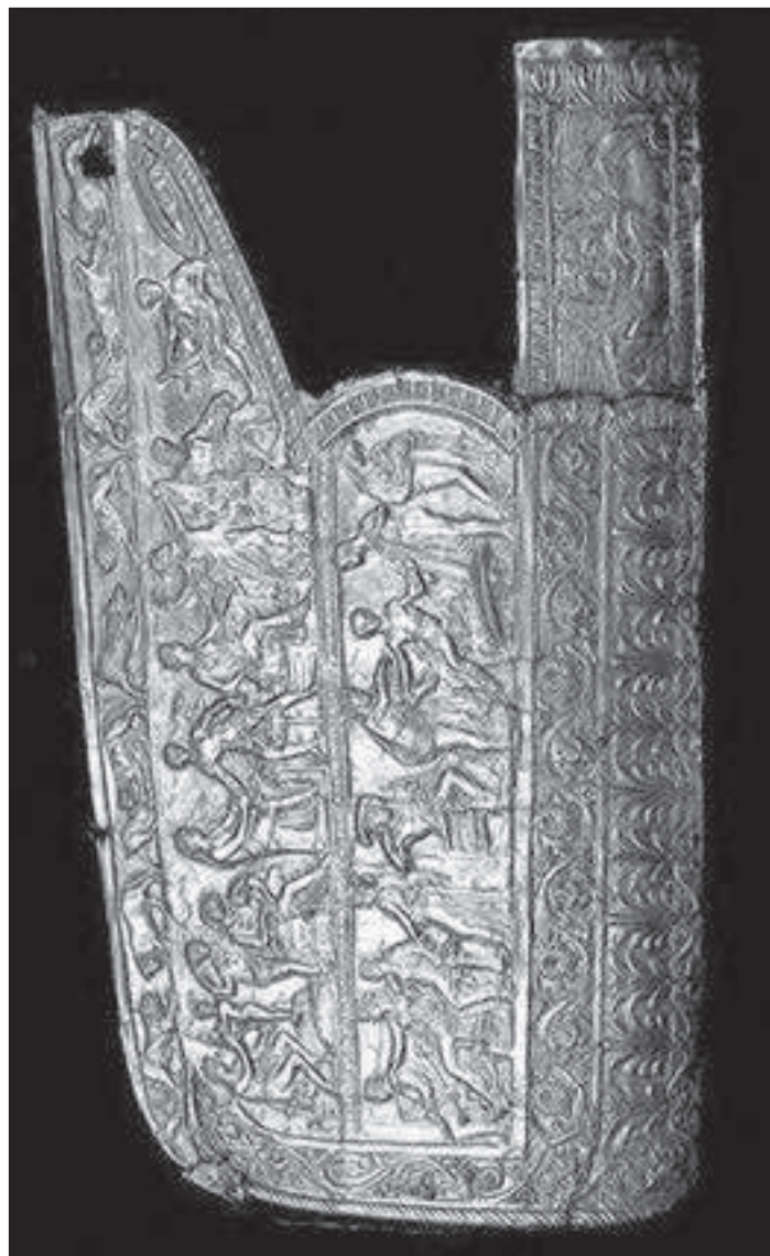
Рис. 2. Обкладка мелитопольского горита [Тереножкин, Мозолевский, 1988, рис. 140].