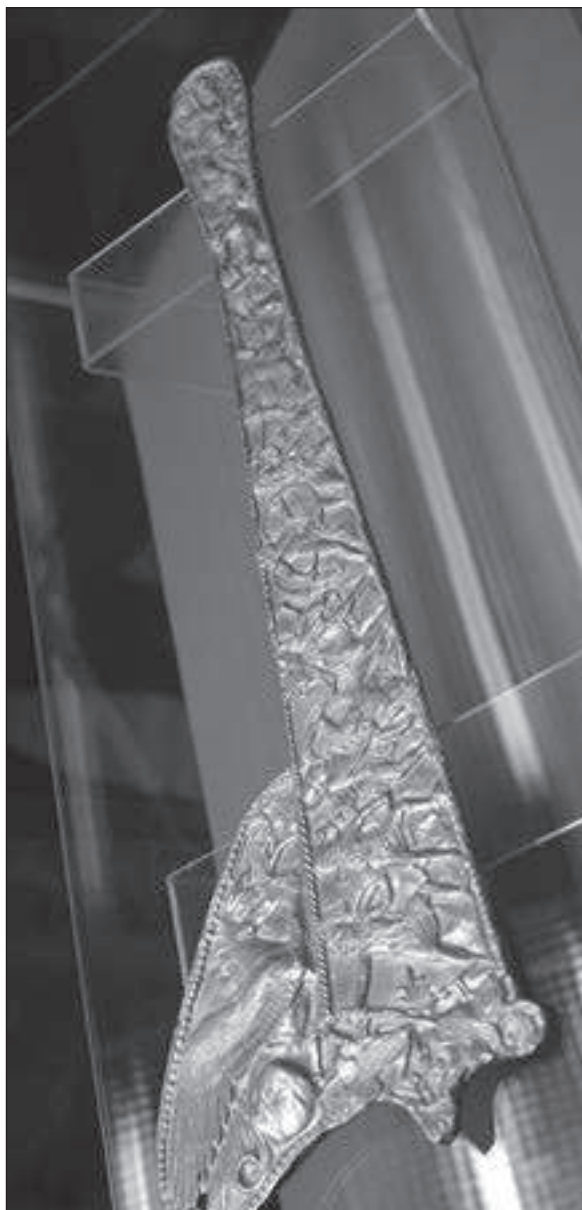
Рис. 7. Обкладка ножен меча из Восьмого Пятибратнего кургана [ https://www.msk.kp.ru/daily/27068/4137878/ Дата обращения 09.04.2010].