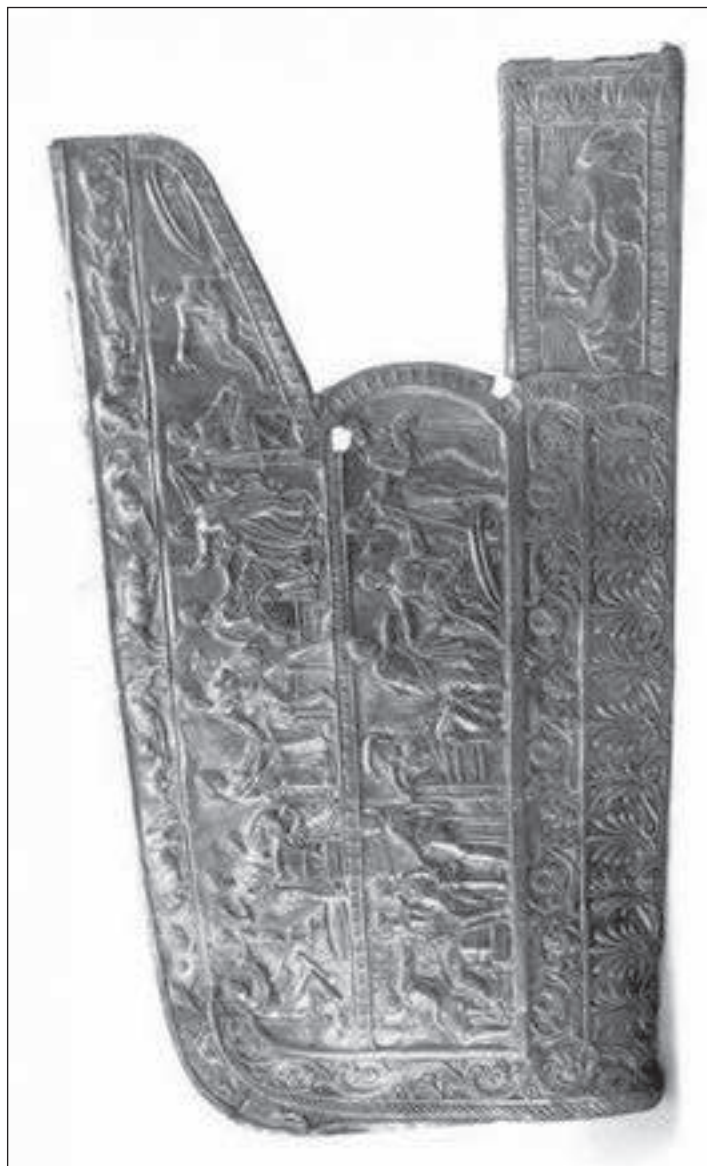
Рис. 1. Обкладка чертомлыкского горита [Алексеев, 2012, с. 207].