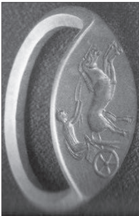
Рис. 11. Золотой перстень-печатка из кургана № 2/2001 Перещепинского могильника около г. Бельска [Супруненко, 2002].