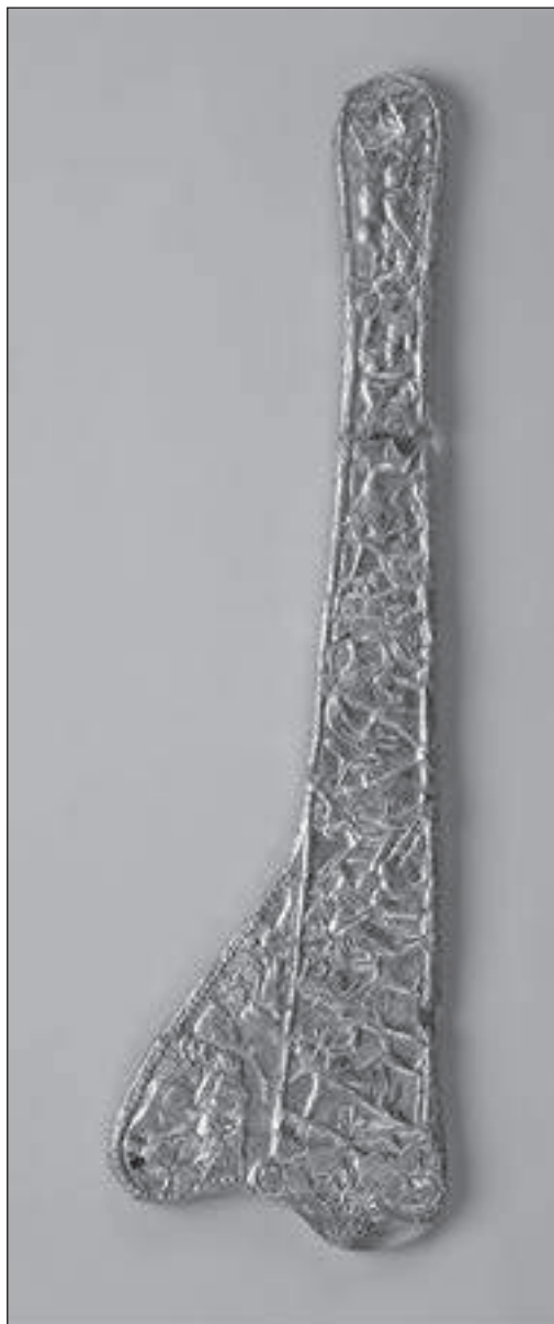
Рис. 8. Обкладка ножен меча из кургана Чаян [Scheglov, Katz, 1991, fig. 1].