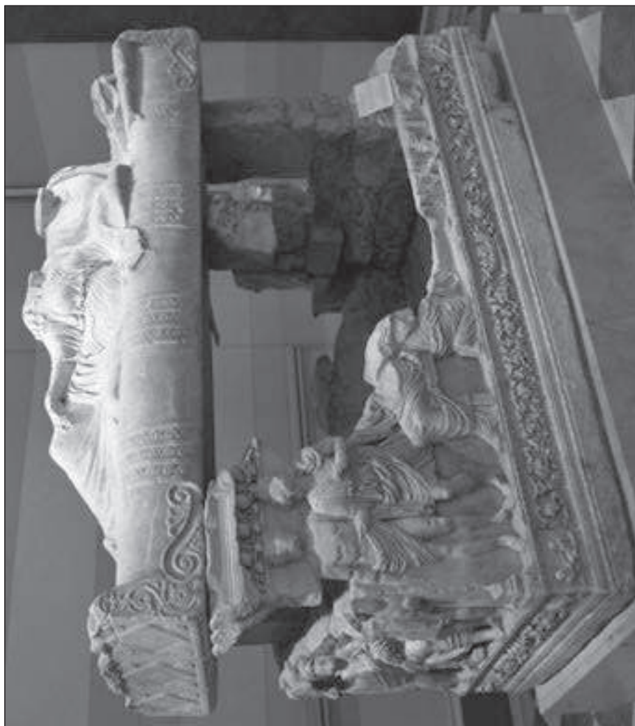
Рис. 4. Мирмекийский саркофаг [Бутягин, Виноградов, 2016].