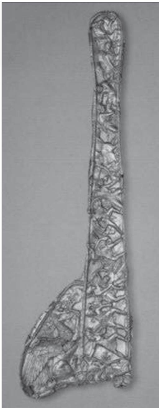
Рис. 6. Обкладка ножен меча из кургана Чертомлык [Алексеев, 2012, с. 214-215].