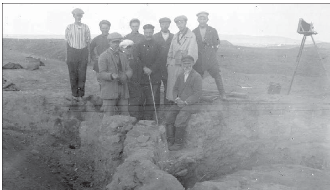
Рис. 10. Участники Фанагорийского отряда Таманской экспедиции, 1931 г. ФО НА ИИМК РАН, отп. О.201/52.