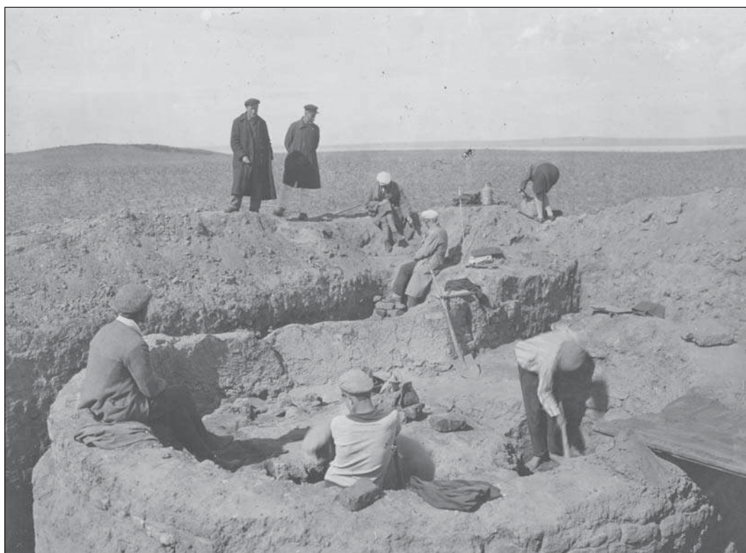
Рис. 7. Ст. Сенная, Фанагория. Раскопки гончарной печи. Материалы Таманской экспедиции, 1931 г. отп. О.199/46.