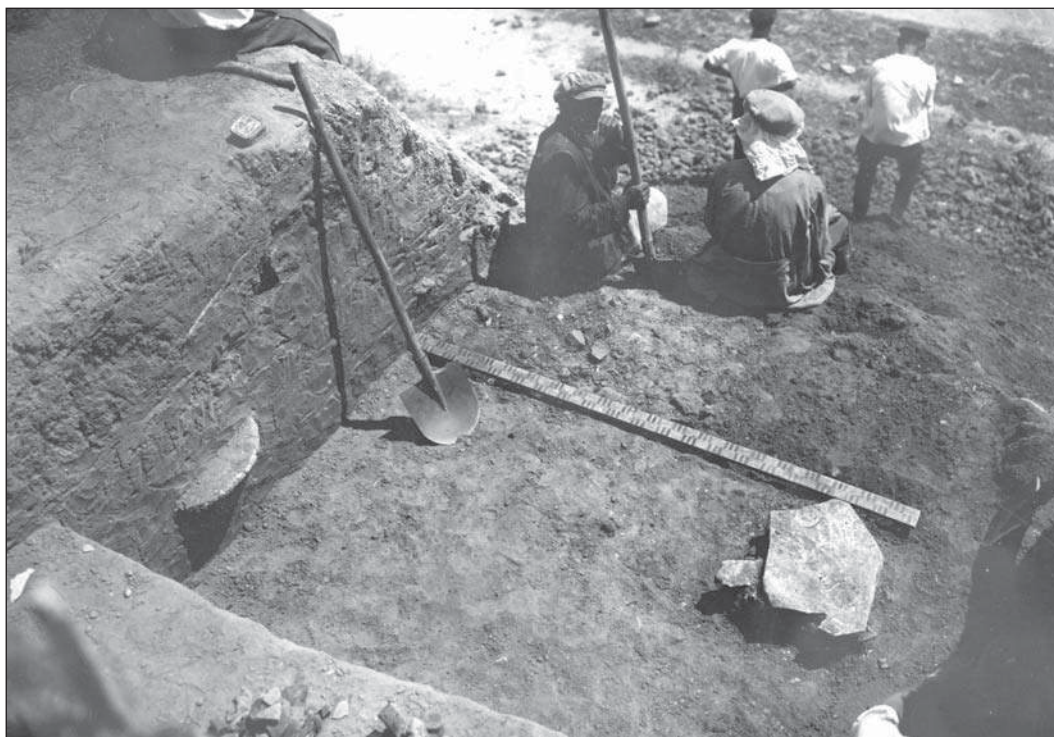
Рис. 3. Раскоп на городище у ст. Сенной. Материалы Таманской экспедиции, 1930 г. Фото А.А. Гречкина. ФО НА ИИМК РАН, отп. О.14/9.