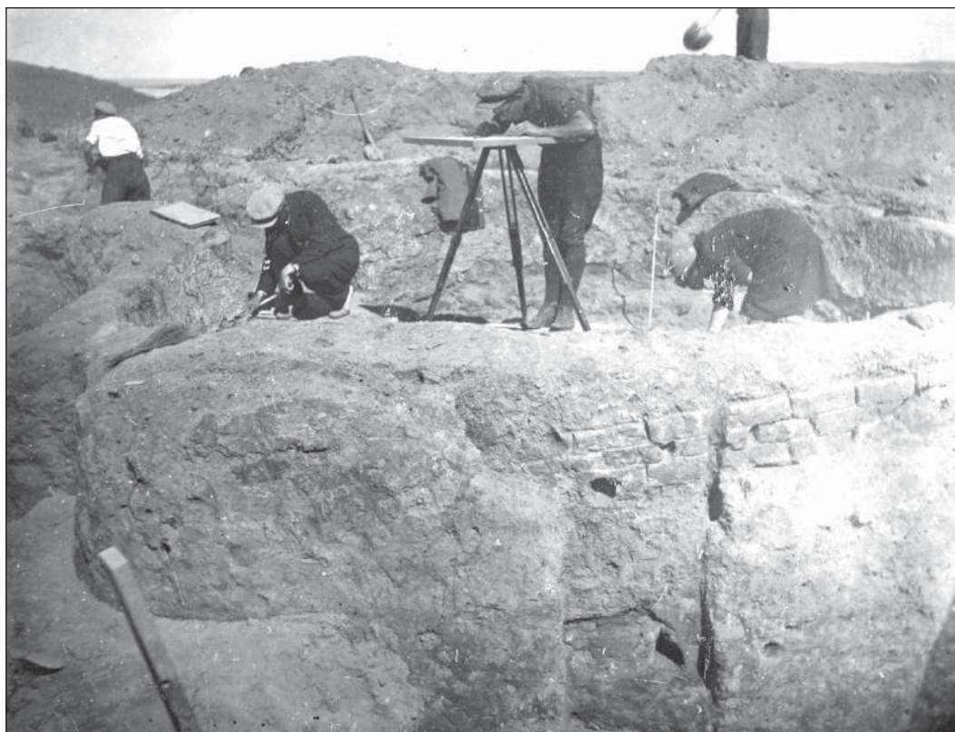
Рис. 6. Ст. Сенная, Фанагория. Начало разборки гончарной печи. Материалы Таманской экспедиции, 1931 г.