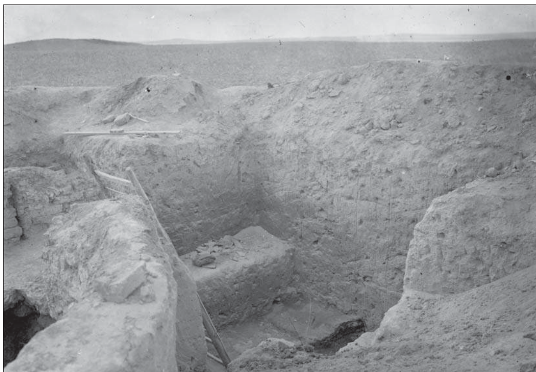
Рис. 9. Участок ВС раскопа гончарной печи после окончания раскопа. Материалы Таманской экспедиции, 1931 г. Фото Е.Н. Бузина. ФО НА ИИМК РАН, отп. О.199/77.