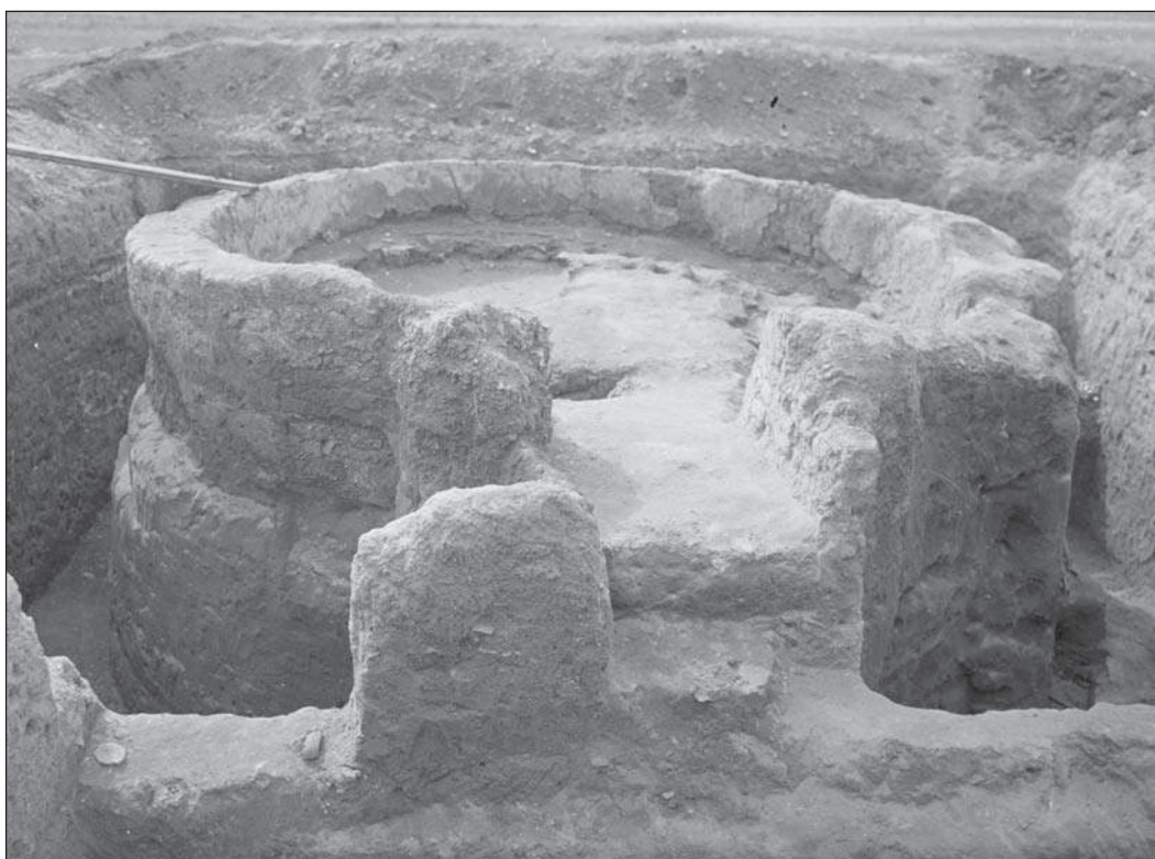
Рис. 8. Ст. Сенная, Фанагория. Гончарная печь после расчистки. Материалы Таманской экспедиции, 1931 г.