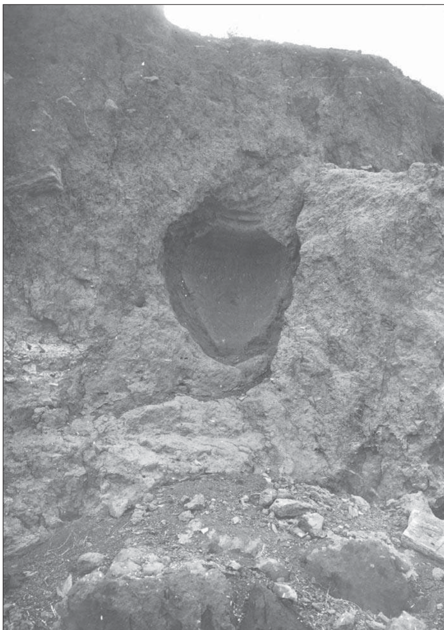
Рис. 5. Отпечаток пифоса в обнажениях культурного слоя городища у ст. Сенной. Материалы Таманской экспедиции, 1930 г. [Ср. с Александрова, 2015, с. 171, рис. 8]. отп. О.14/6.