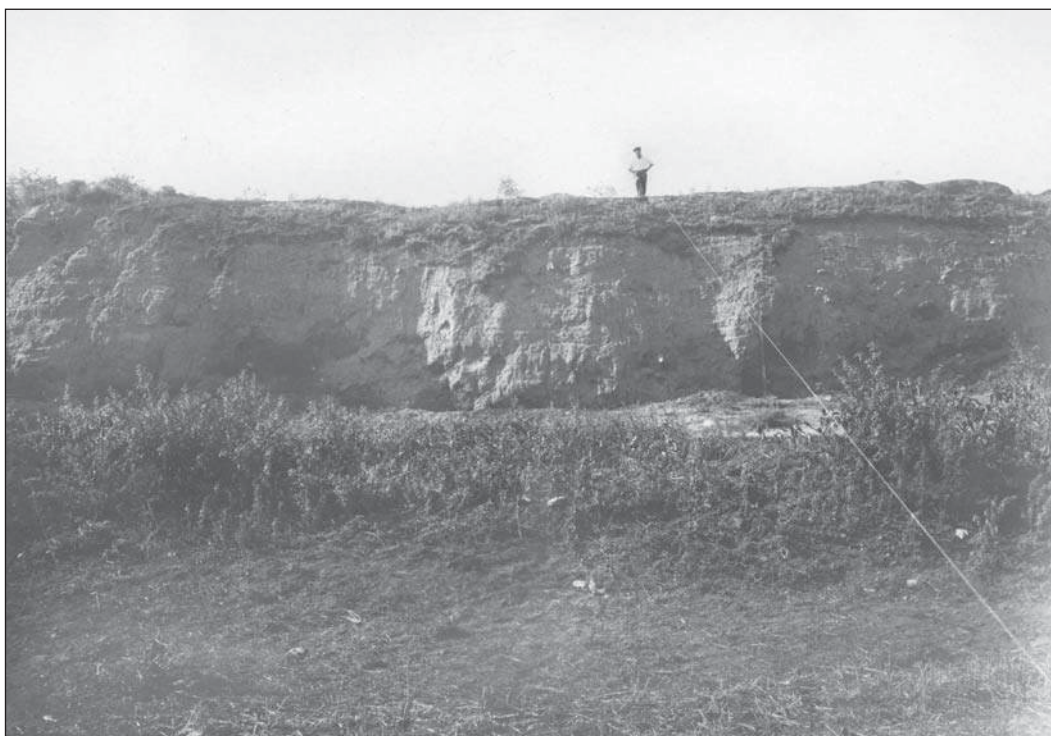
Рис. 2. Береговые отложения городища у ст. Сенной. Материалы Таманской экспедиции, 1930 г. Фото А.А. Гречкина. ФО НА ИИМК РАН, отп. О. 14/5.