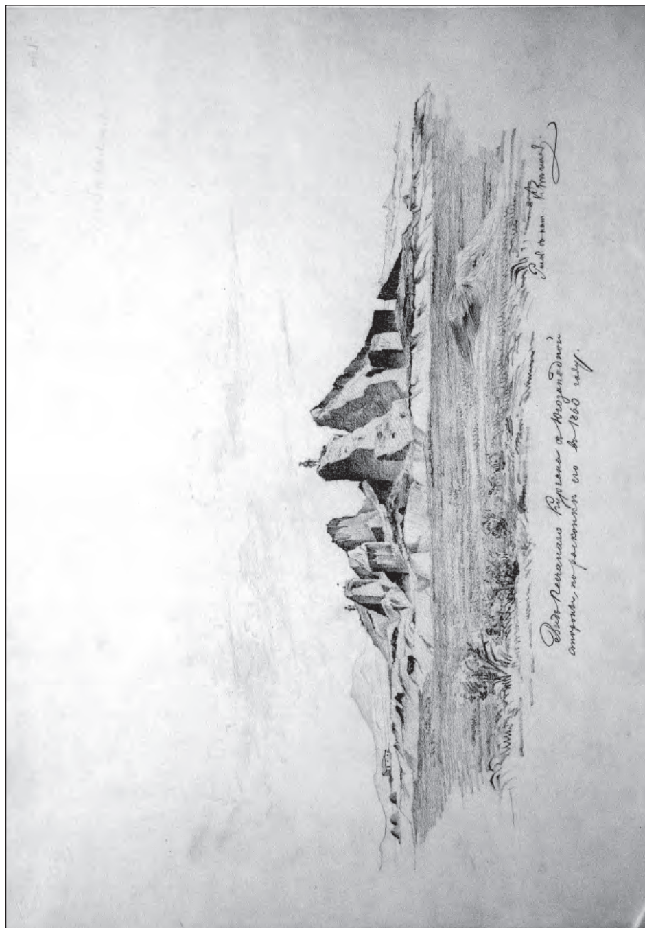
Рис. 3. Песчаный курган после раскопок 1860 г., вид с юго-запада [Р. 1, № 691, л. 14].