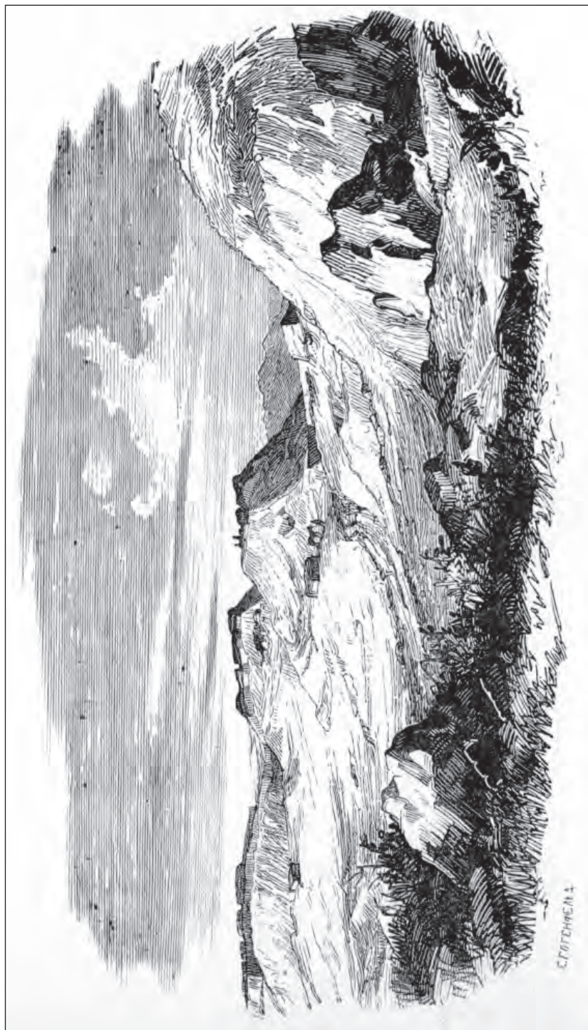
Рис. 4. Раскопки курганов на Павловском мысу [Толстой, Кондаков, 1889а].