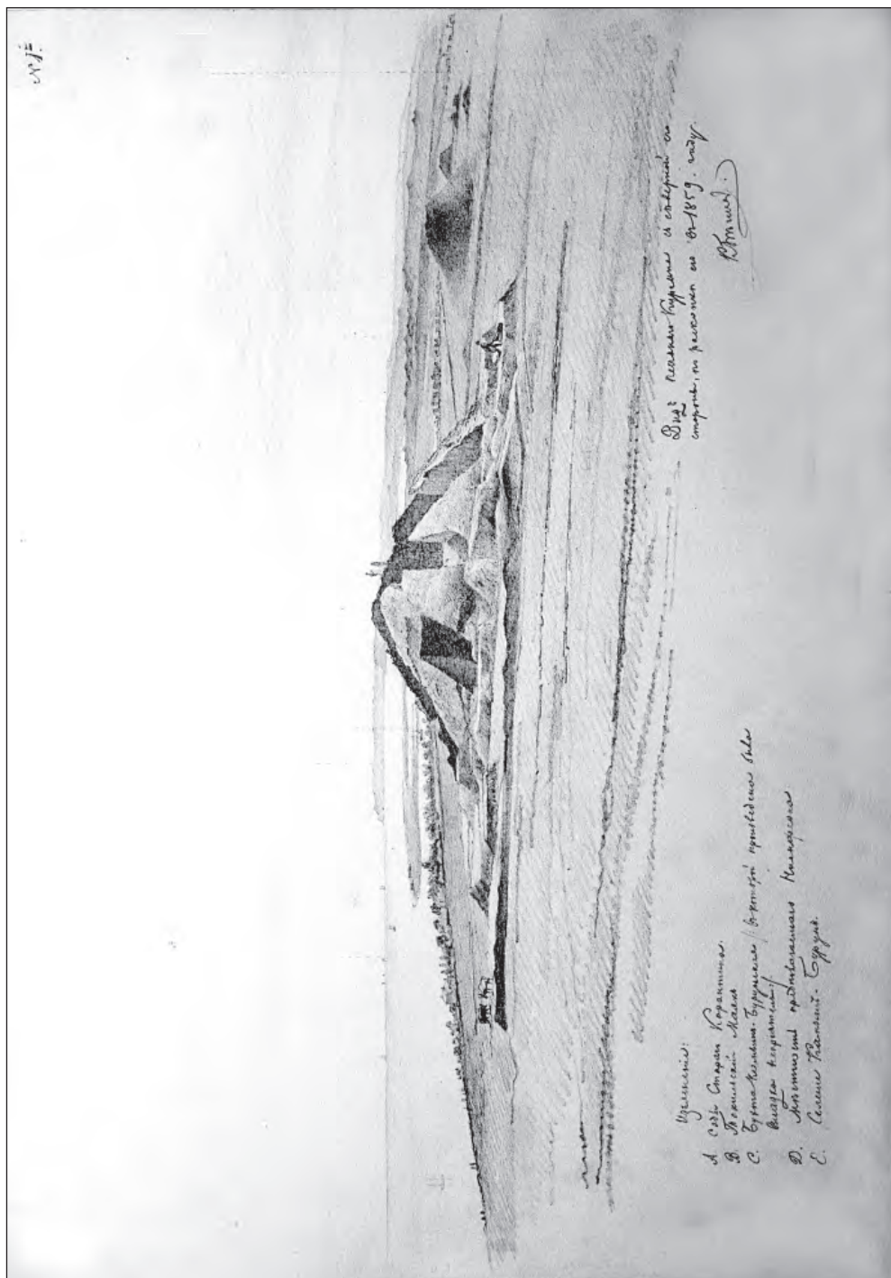
Рис. 2. Раскопки курганов Юз-Обы в 1859 г., на переднем плане Песчаный курган [Р. 1, № 691, л. 1].