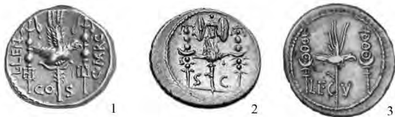
Рис. 3. Республиканские монеты с изображениями сигнумов: