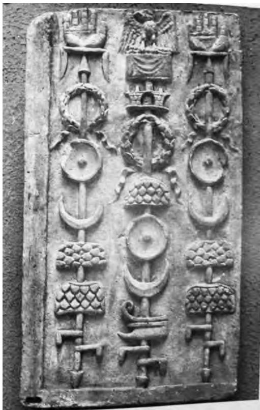
Рис. 4. Штандарты на рельефе из Рима [Webster, 1969, p. 81, pl. X].