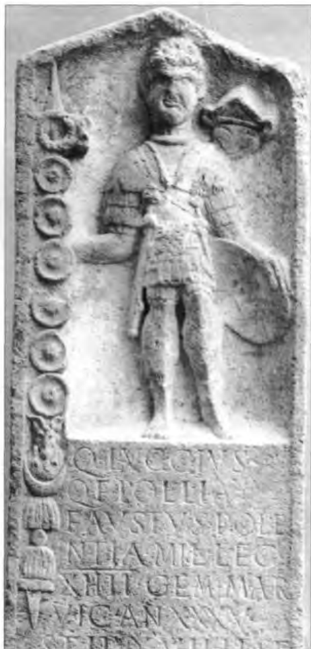
Рис. 5. Надгробие Люция Фауста, сигнифера XIV Парного легиона. 70-92 гг. (Земельный музей, Майнц).