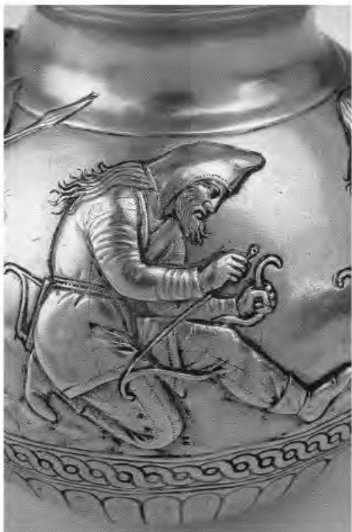
Рис. 1. Изображения скифов на предметах из кургана Куль-Оба.