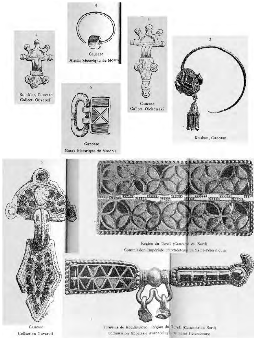
Рис. 3. Находки «готского» стиля с Северного Кавказа.