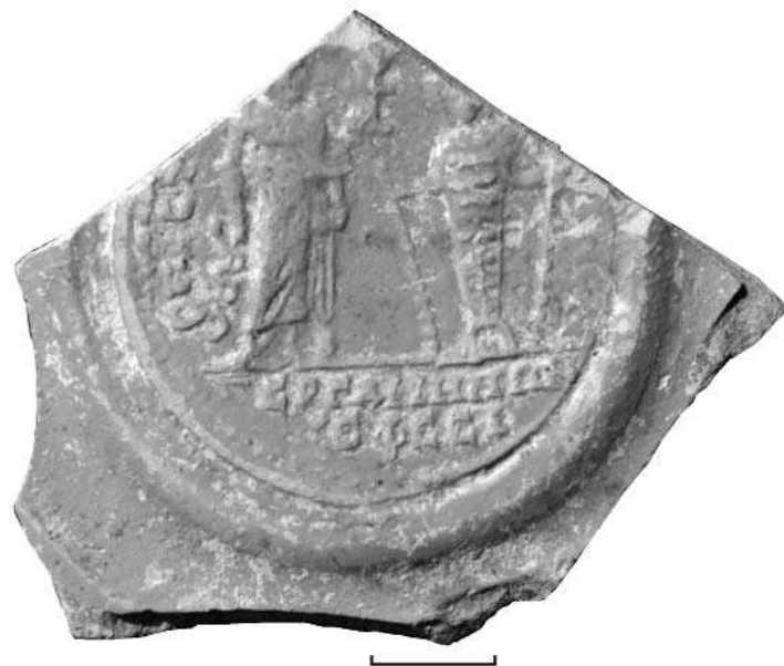
Рис. 1. Фото рельефного медальона. Хранится в Восточно-Крымском историко-культурном заповеднике. Инв. № КМАК – 20414.