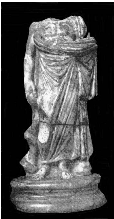
Рис. 3. Статуя Асклепия из коллекции Эрмитажа.