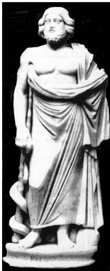
Рис. 4. Статуя Асклепия из музея Пафоса на Кипре.