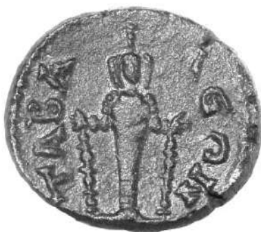
Рис. 5. Лидийская монета.