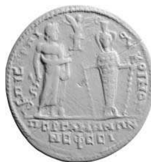
Рис. 6. Пергамская монета.