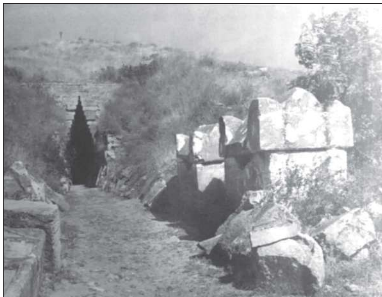
Рис. 1. Царский курган. Фото Ю. Панютина. 1945–1949 гг. (По материалам https://pastvu.com/p/1631881 ).