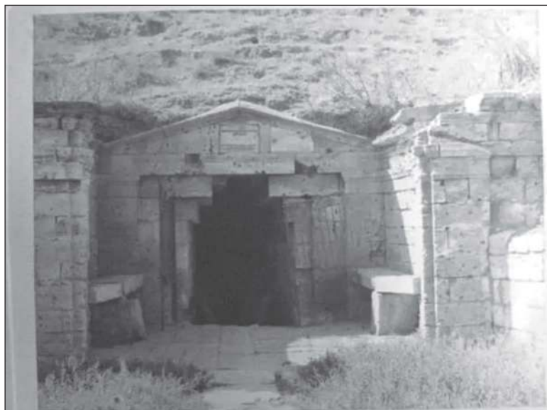
Рис. 2. Мелек-Чесменский курган. 1945–1949 гг.