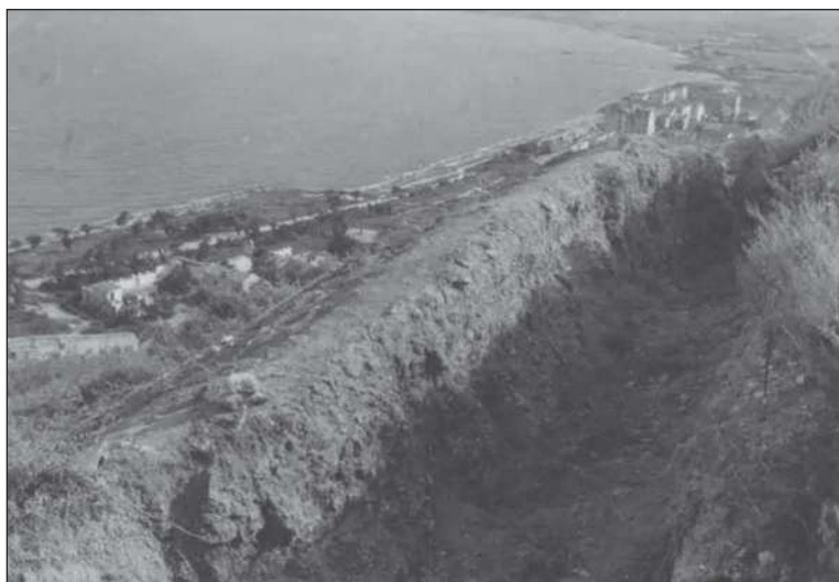
Рис. 3. Немецкая траншея на горе Митридат. 1945 г. (Блаватский В.Д. Отчет о раскопках в Пантикапее в 1945 г. // Архив ИА РАН. Ф. 1. Оп. Р-1. Д. 29. Л. 26).