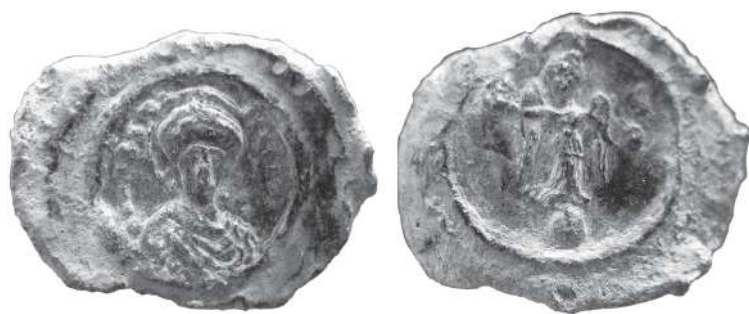
Рис. 1. Печать императора Анастасия I (491–518).