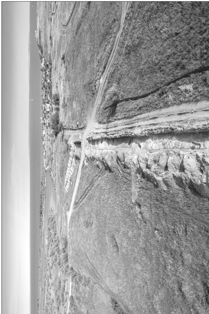
Рис.1. Вид сверху с запада на восточную часть раскопа 2022 г.